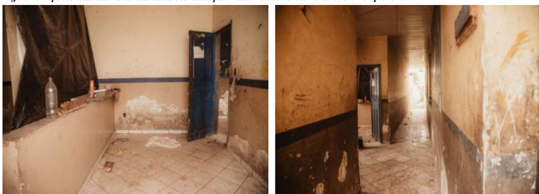
Figura 3: As paredes e estrutura de alvenaria danificadas pela ação do tempo.