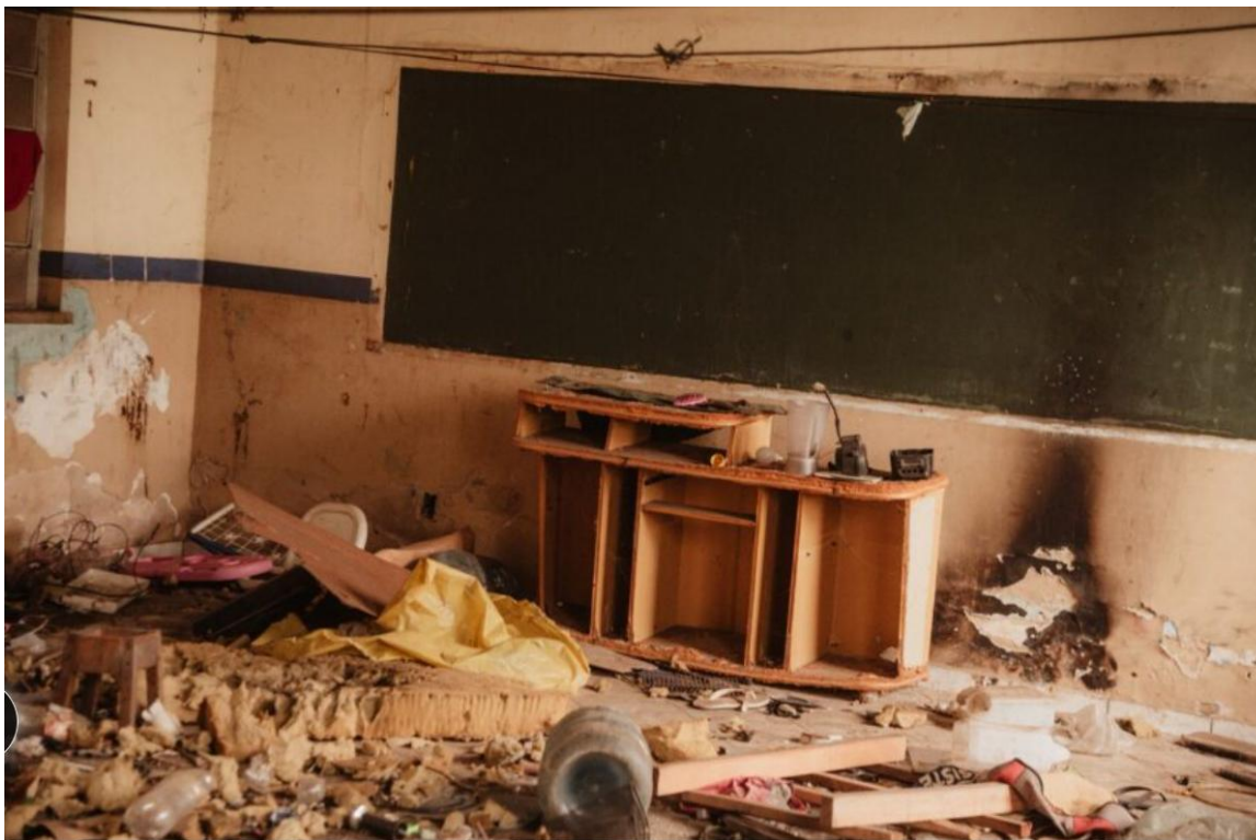
Figura 1: Sala de aula totalmente tomada por intulho.