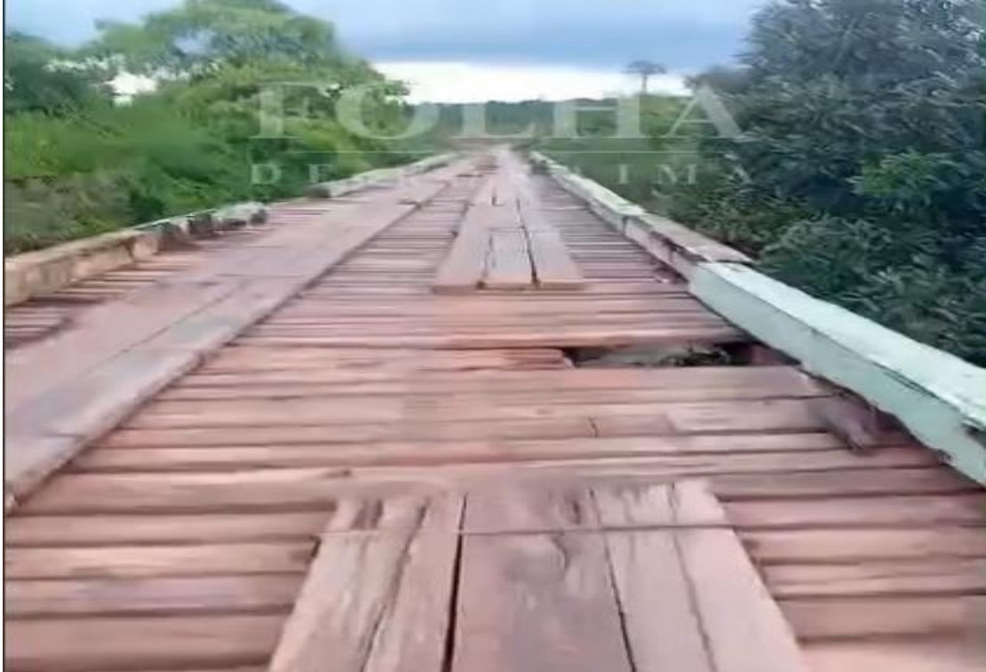
Figura 2: Ponte com ausência de assoalho e rodeiros; Fonte: Instagram.