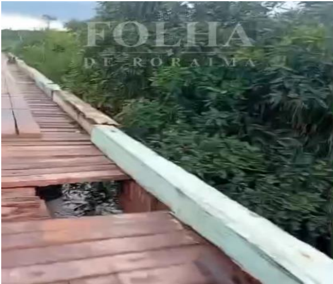
Figura 4: Buraco no assoalho da ponte do Rio Cauamé.