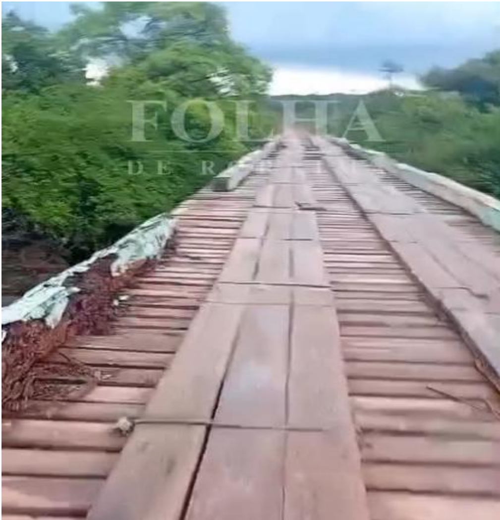
Figura 1: Ponte com Guarda-rodas ausente e se esfarelando.