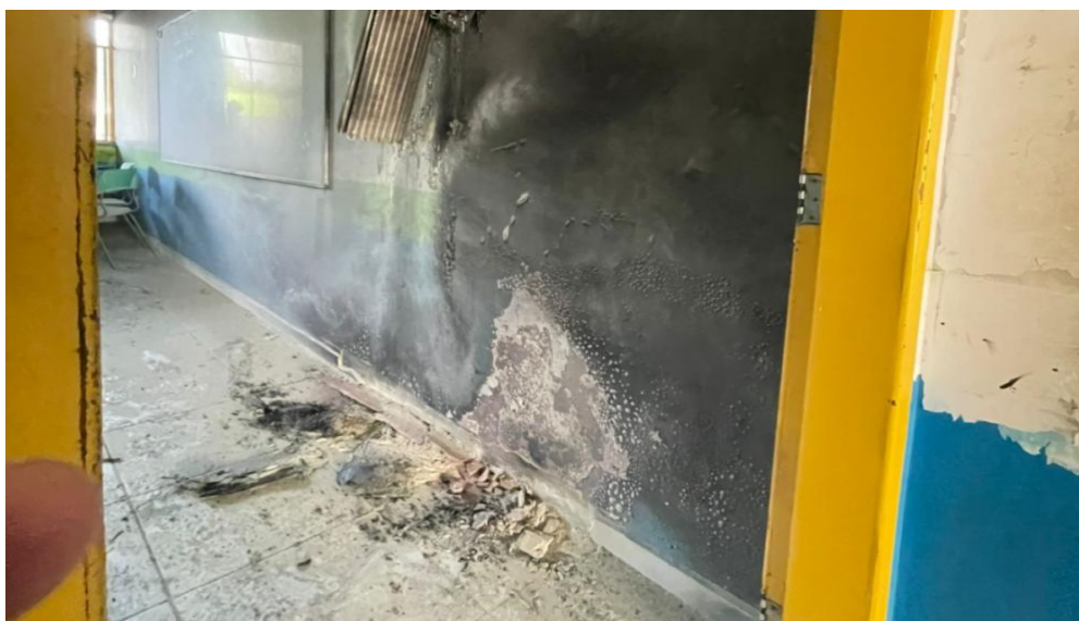
Figura 3: As paredes e a lousa ficaram queimadas e danificadas, danificando a pintura e deixando com alvenarias comprometidas.