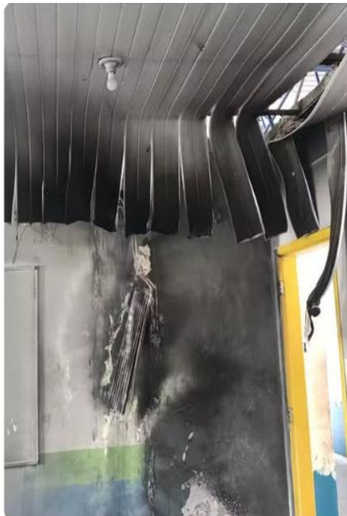
Figura 1: Parte do forro e da pintura da sala de aula da Escola ficaram destruídos devido o fogo intenso causado pelo incêndio.