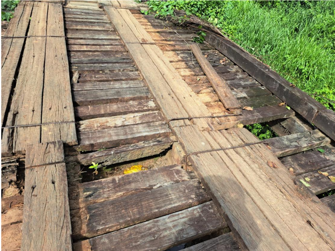
Ponte da Vicinal 239 (Pedra Branca), região do Paredão, no município de Alto Alegre (N 03°16'48.50" / O 061°34'39.20")