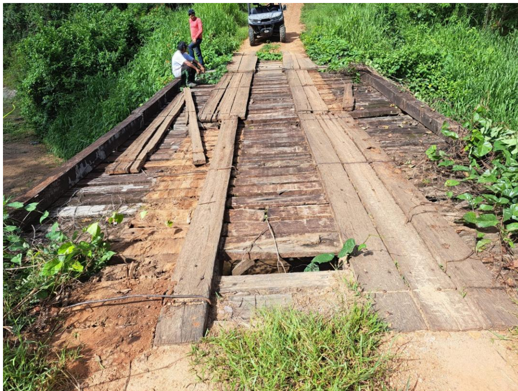
Ponte da Vicinal 239 (Pedra Branca), região do Paredão, no município de Alto Alegre (N 03°16'48.50" / O 061°34'39.20")