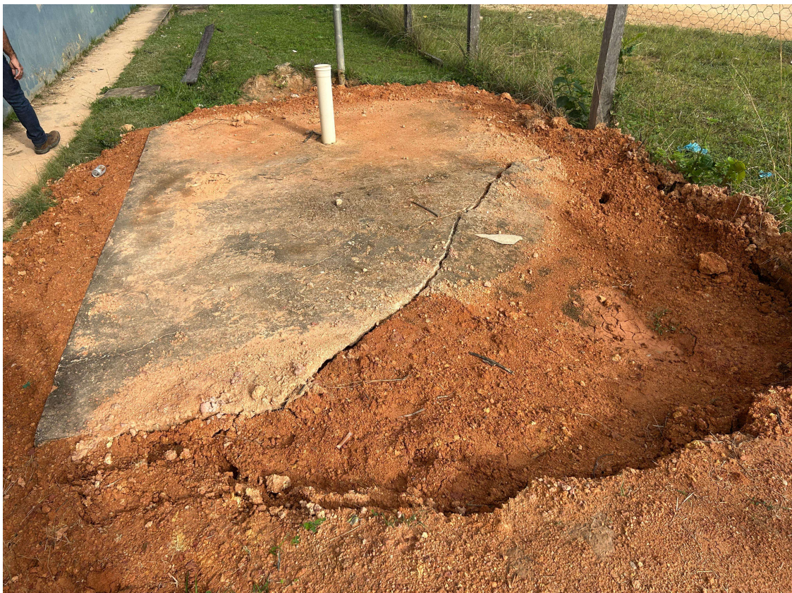
Boa Vista – Roraima – Brasil