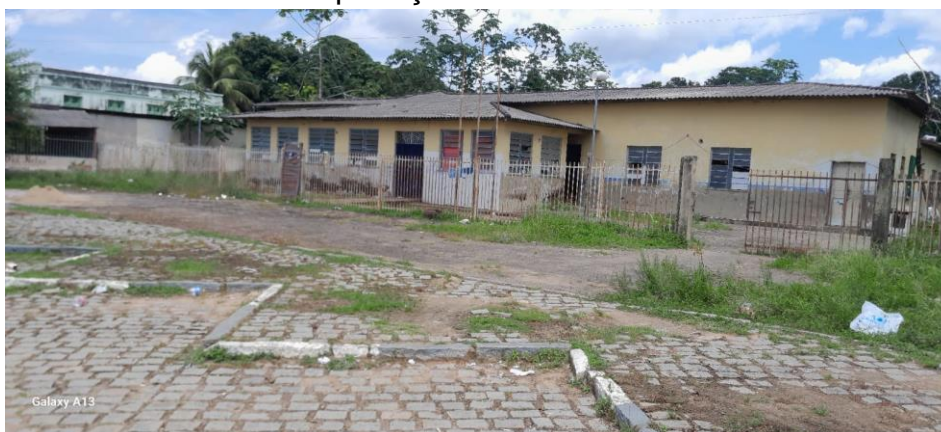
FRENTE DA ESCOLA

Apesar das condições precárias, observa a supracitada escola Estadual, ainda tem pessoas morando nesse lugar insalubre e sem nenhuma estrutura e proteção do Estado.