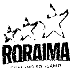
OTTOMAR DE SOUSA PINTO Governador do Estado de Roraima

Palácio Senador Hélio Campos Praça do Centro Cívico s/nº · CEP: 69.301-380 · Boa Vista-RR – Brasil PABX: 0**(95) 623-1410 · Fax: 0**(95) 623-2344/623-9945 Lao - 13/12/2004 19:44:40